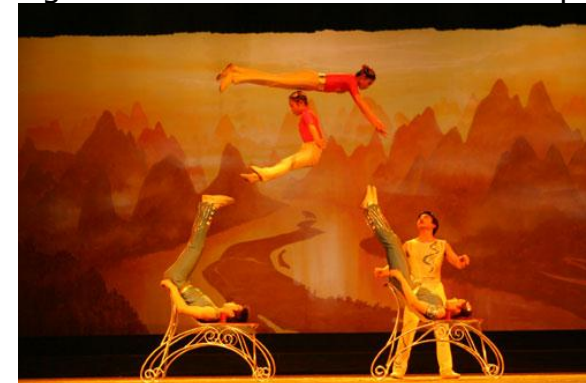
Des jeux icariens