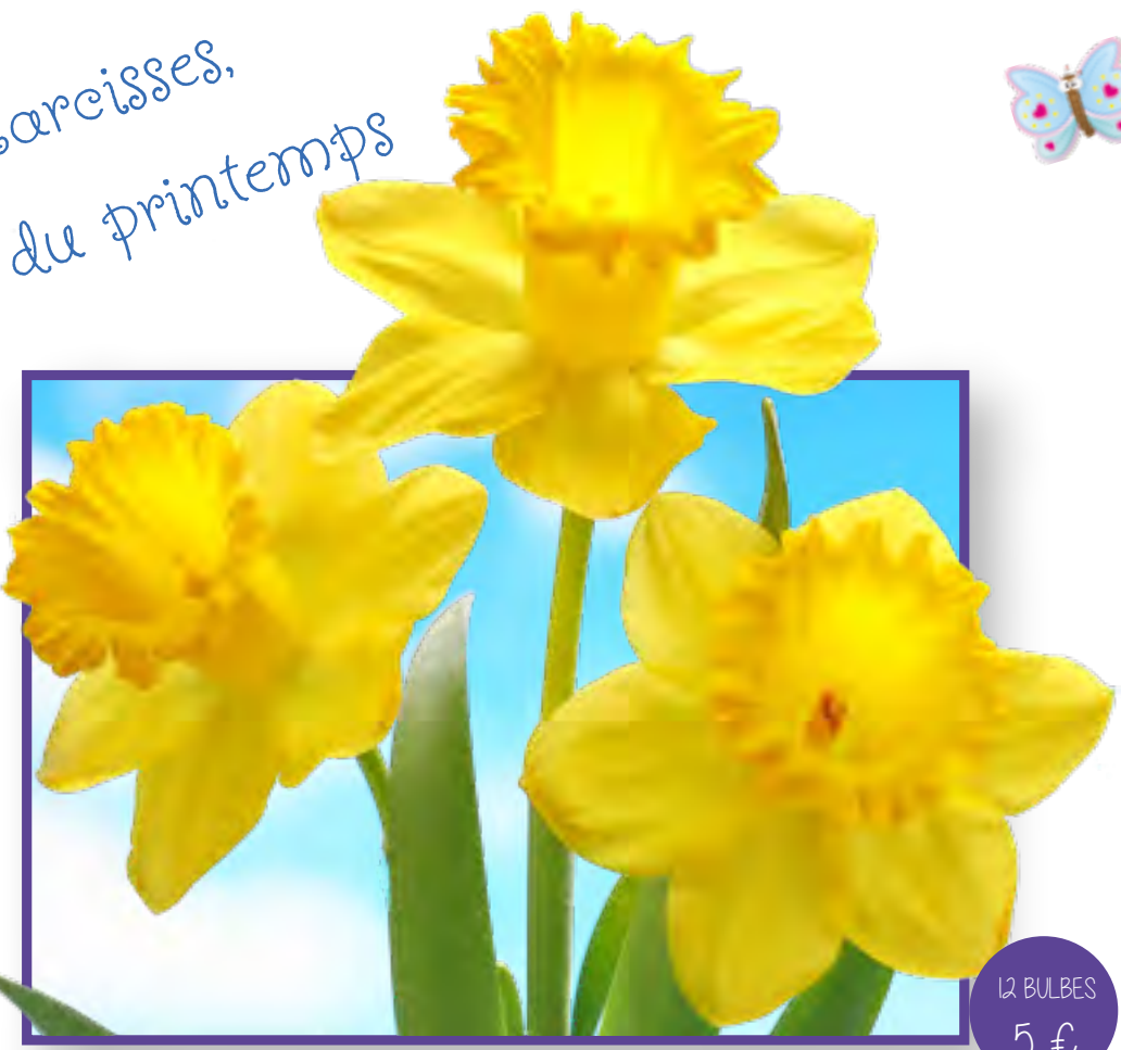
Art 2 - Narcisses à Trompettes Jaunes NARCISSUS DUTCH MASTER