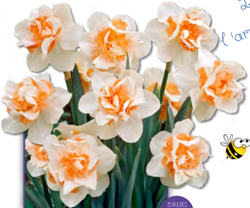
Art 27 - Narcisses Doubles Replete NARCISSUS DOUBLE REPLETE