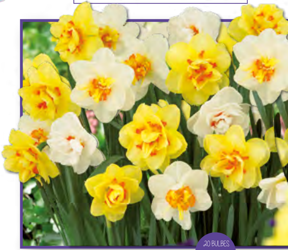
Art 26 - Narcisses à Fleurs Doubles NARCISSUS DOUBLE