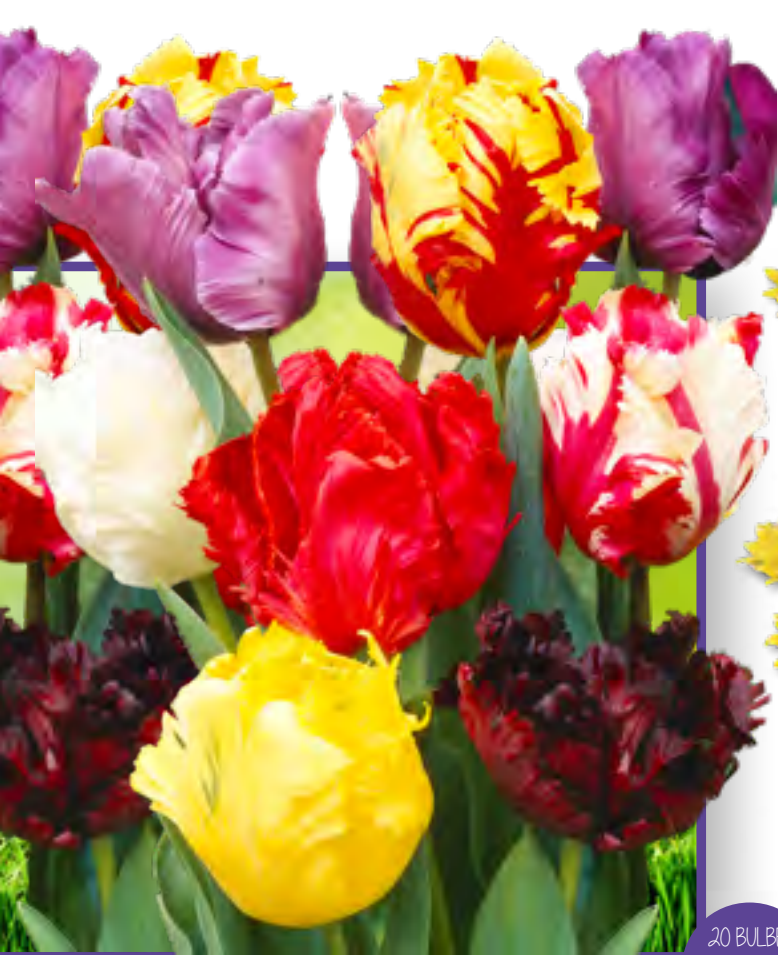
Art 1 - Tulipes Perroquet TULIPA PARROT