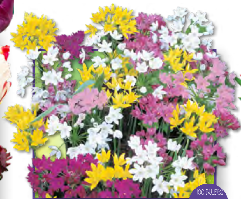
Art 14 - Alliums Mélange ALLIUM