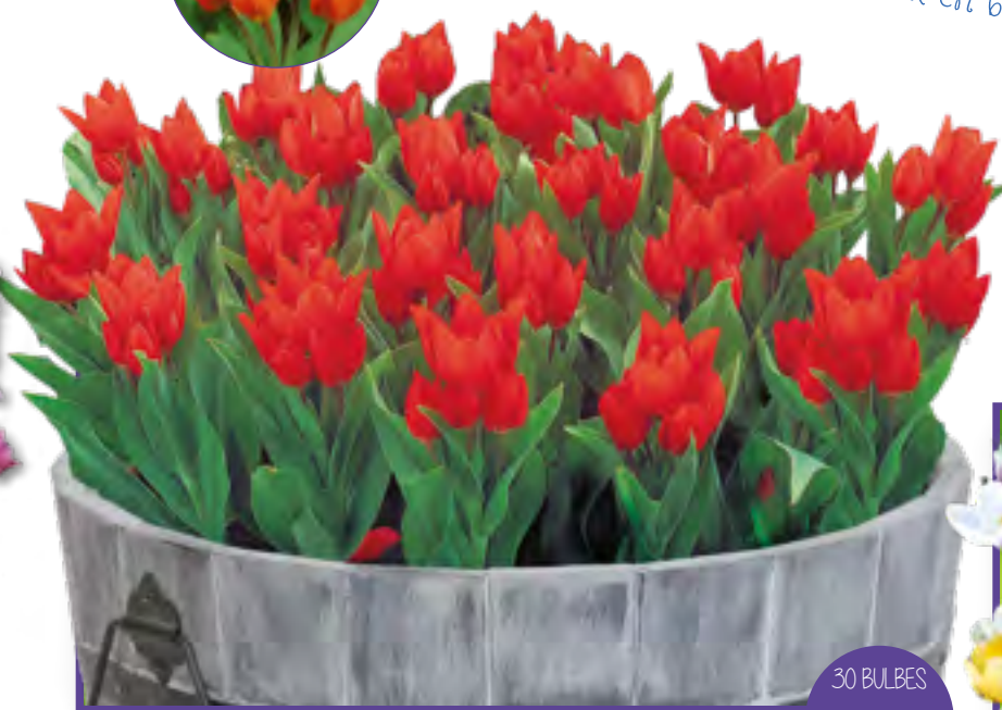
Art 30 - Tulipes Pluriflores Zwanenburg TULIPA PRAESTANS ZWANENBURG