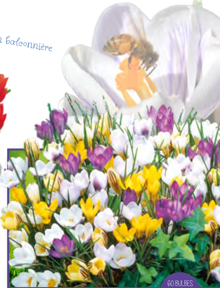
Art 23 - Mélange Crocus Botaniques CROCUS BOTANIC